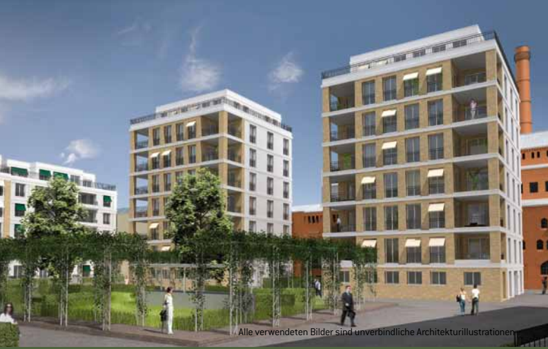
Alle verwendeten Bilder sind unverbindliche Architekturillustrationen