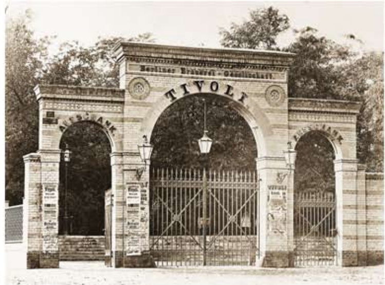
Das Eingangstor zum #137162.jpg