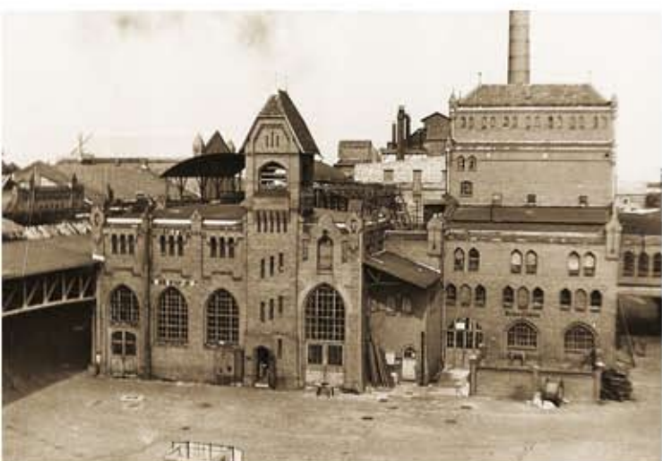
Das historische Kess#139534.jpg