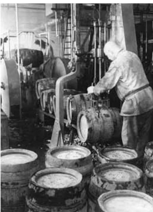
Verschließen der Fässer.jpg