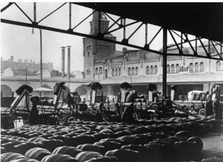
Lagerung der Bierfäs#137163.jpg