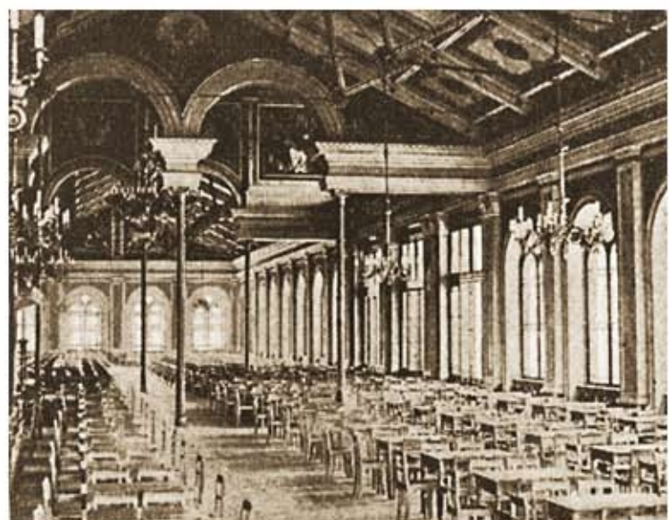
Innenansicht des Tiv#138B5B.jpg