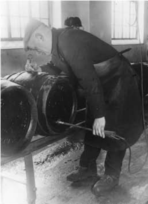
Kontrolle der Fässer.jpg