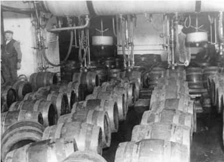
Abfüllung in Fässer.jpg